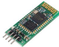
Module Bluetooth :