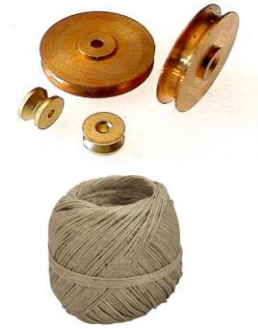
Poulie et ficelle :