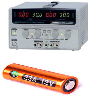
Alimentation électrique ou batterie :