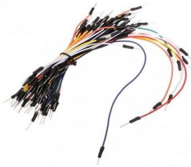
Fils électrique :